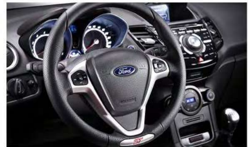
Tablero ergonómico con controles en el volante y sistema audio Sony® de alta fidelidad