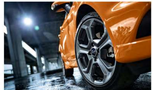
Rines de aluminio de 17" con llantas deportivas y frenos de disco con carga regenerativa