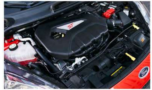
Motor 1.6L EcoBoost® de 197 HP y 202 lb/pie