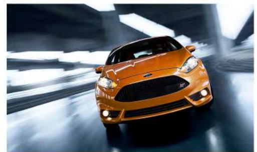
Parrilla trapezoidal con exclusivo emblema ST y luces de niebla

Ford Motor Company se reserva el derecho de modificar en sus productos: especificaciones técnicas, opciones de equipamiento, combinaciones de accesorios y colores, en cualquier momento, sin incurrir en responsabilidad alguna. La presente ficha técnica no incluye información relativa a cambios de producto, incorporación de opciones, requerimientos de ordenamiento o limitaciones de disponibilidad que hayan sucedido posteriormente a la publicación de la misma. Consulte a su Distribuidor Ford más cercano para obtener información actualizada. Las imágenes son meramente ilustrativas.